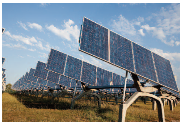
Centrale solaire de Montesquieu conçue et installée par EXOSUN