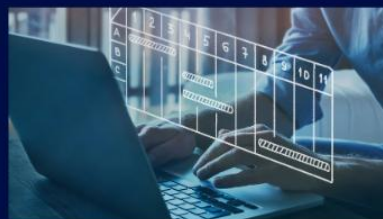
Méthodologie, Gestion de projet