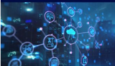
IoT, Réseaux, Communication