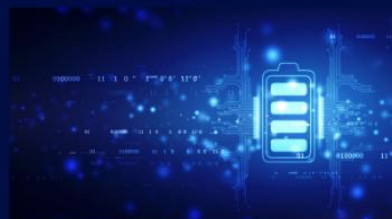
Gestion de l'énergie, Batteries & Thermique