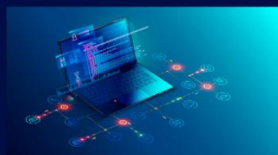
Logiciel embarqué, Programmation