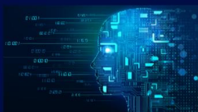
IA, Traitement de l'image & du signal